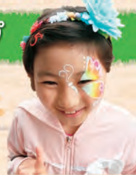
フェイスペイント (11日のみ)