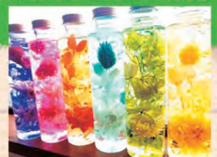
ハーバリウムづくり (10日のみ)