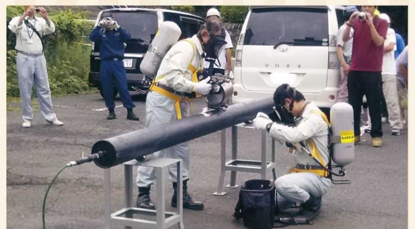
酸素マスクを装着し、修理中。